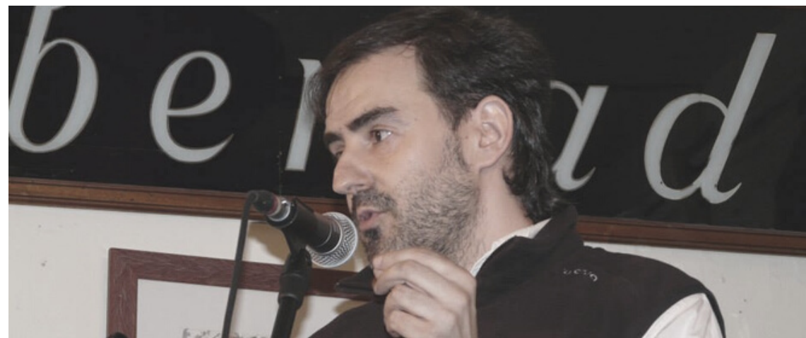
Sobre los autores